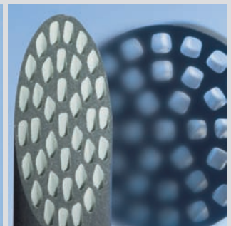
carrier material cross-section Querschnitt Membranrohr