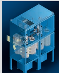
Dry Dust Collector Trockenentstauber EuroJet