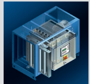
Electrostatic Filter Elektrofilter MultiTron Junior Premium