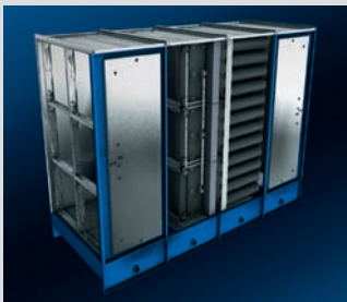
Universal Duct-Air Filter Universal-Kanalluftfilter MultiMaster Vario

Seit 100 Jahren befasst sich die GEA Delbag Lufttechnik GmbH mit der Luftfiltertechnik. Weltweit zählt Delbag zu den bedeutendsten Unternehmen der Filter- und Entstaubungstechnik. So wird bei Delbag nicht nur produziert, sondern auch geforscht und entwickelt. Zahlreiche Patente und Ergebnisse aus Laboruntersuchungen zeugen von dem hohen technischen Niveau unserer Produkte. Die Mitarbeit der GEA Delbag in vielen Ausschüssen beweist unsere Qualifikation. GEA Delbag Lufttechnik GmbH liefert von einzelnen Komponenten bis hin zu kompletten, schlüsselfertigen Anlagen; von der Projektierung bis zur Inbetriebnahme. Für Technik, Qualität, Verarbeitung, fachgerechte Beratung und zuverlässigen Service verbürgen wir uns mit unserem guten Namen. Wir bieten Ihnen individuelle Lösungen für Ihre Anwendungsfälle im Bereich der Luftreinhaltung und Luftaufbereitung. Firmenphilosophie: Energetisch, ökologisch und ökonomisch optimierte, zukunftssichere Luftfilterprodukte. Tätigkeitsprofil: Bewährte Serien-Produkte für die Zu- und Abluftfiltration • Zuverlässige Ingenieurtechnik für Anlagen und Systeme zum Absaugen und Abscheiden von Stäuben, Aerosolen und gasförmigen Schadstoffen aus Prozessen sowie beim Arbeitsplatz und Umweltschutz • Umfangreiches Ansaugfilterprogramm bestehend aus Pulsfiltern, statischen Filtern bis hin zu Fliehkraftabscheidern und Ölbadfiltern für Gasturbinen, Verdichter, Motoren und Prozessluft.