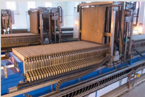
Filter presses Filterpressen

ANDRITZ übernimmt Verantwortung – mit weltweit situierten Produktionsbetrieben, Servicezentren und Reparaturwerkstätten in Europa, den USA und Asien sind unsere ANDRITZ Mitarbeiter in Ihrer unmittelbaren Nähe.